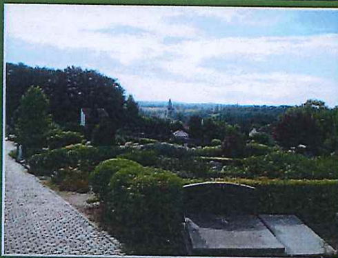
« Une vue imprenable sur l'église d'Ohain. »