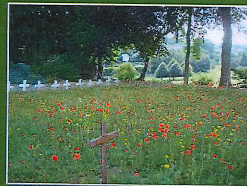
« Même l'ossuaire n'est pas oublié, un champ de coquelicot le côtoie ! »