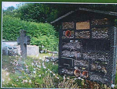
« Contrairement aux aprioris, l'intégration d'hôtels à insectes se marie parfaitement au décor environnant. »