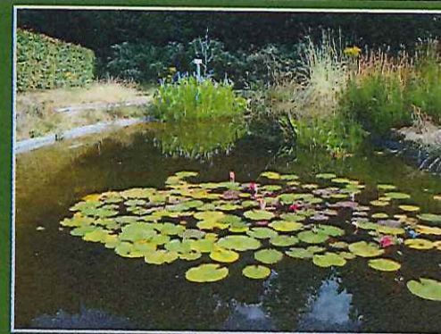
« La mare du cimetière d'Ohain apporte de la sérénité et du calme pour les personnes qui se recueillent. »